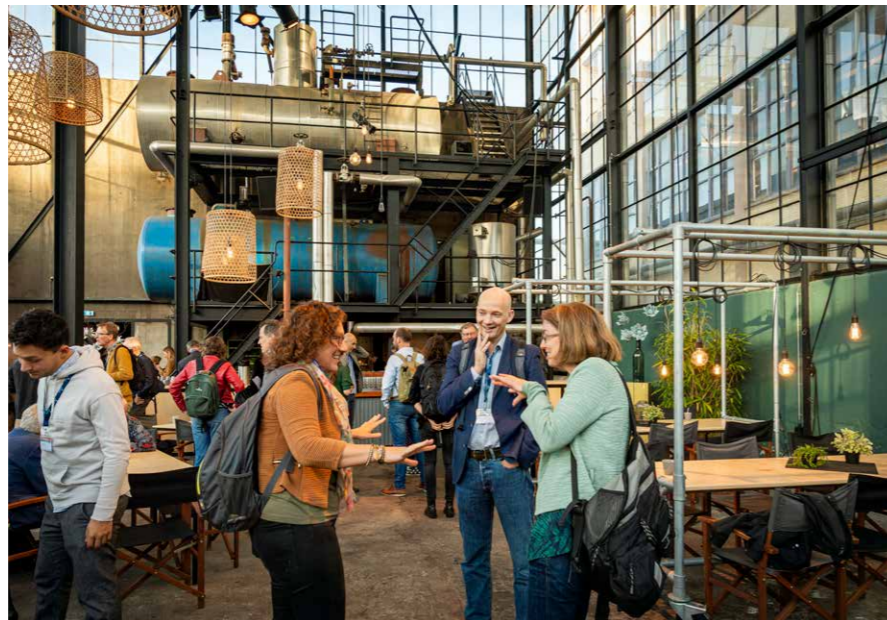
Ontmoetingen tijdens de Noordzeedagen

Hier de link: https://vimeo.com/630836581/61a83f5f55