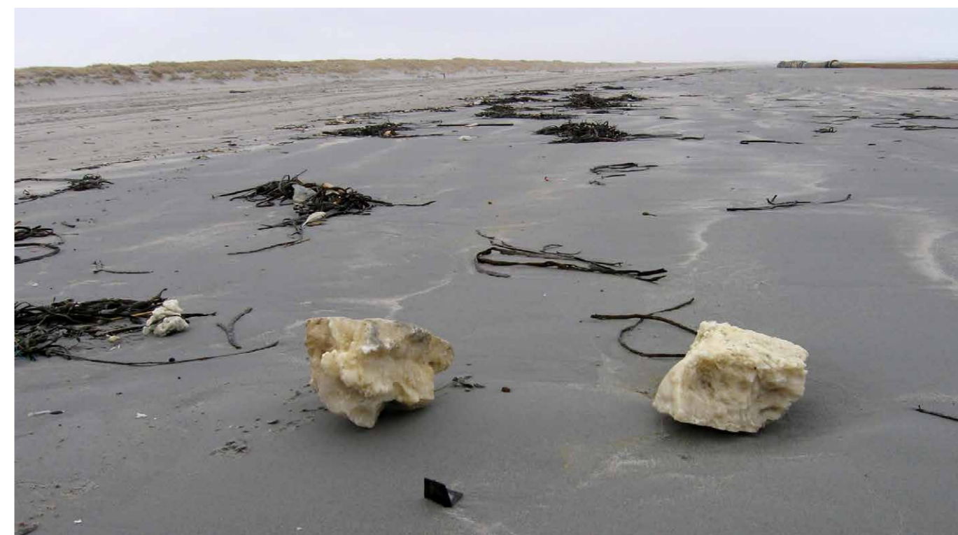
Waarneming van het Crisisteam Rijkswaterstaat

We hopen natuurlijk dat zoveel mogelijk Europese landen ons voorbeeld al voor 2021 volgen, want ondanks onze intentieverklaring kunnen schepen in andere havens nog altijd voor paraffine aanspoelingen zorgen. In maart 2019 werden er bijvoorbeeld toch weer paraffinebrokken op de Nederlandse stranden gevonden, gelukkig in relatief kleine hoeveelheden. Grootschalige schoonmaakacties heeft Rijkswaterstaat sinds 2018 nog niet hoeven te ondernemen. Laten we hopen dat dit ook in de toekomst niet meer nodig is!”