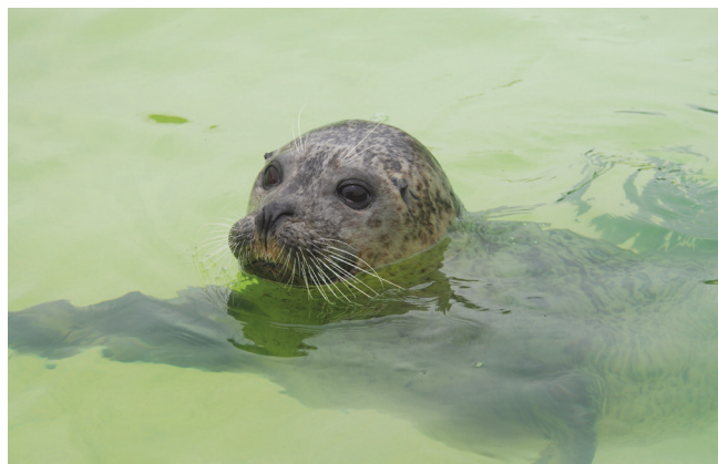
Gewone zeehond

Menselijke activiteit en natuur zijn van oudsher verweven met de Vlakte van de Raan. Door het gebied lopen twee belangrijke routes voor de beroepsscheepvaart: de Wielingen en het Oostgat. Daarnaast wordt in het gebied al generaties lang gevestigd op onder meer garnalen en platvis. Ook onder zeilers, sportvissers, duikers en andere recreanten is de Vlakte van de Raan een geliefd gebied.