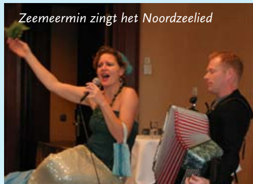
Zeemeermin zingt het Noordzeelied

Deze zomer stelde de ministerraad het Integraal Beheerplan Noordzee 2015 (IBN 2015) vast. In oktober stemde de kamer ermee in. Het Interdepartementaal Directeurenoverleg Noordzee (IDON) heeft dit heugelijke feit aangegrepen om een symposium te organiseren voor de betrokken partijen: beleidsmakers, beheerders, vertegenwoordigers van sectoren en belangenorganisaties. Met als thema Samen op de Noordzee : hoe blijft het beleid op en beheer van de Noordzee op de toekomst gericht. Op 15 december 2015 vond dit symposium plaats, op een daartoe geëigende plaats: de Hotels van Oranje in Noordwijk, van waar men uitzicht had op de Noordzee. Behalve van gedachten gewisseld over het vervolg is er ook een toast uitgebracht op de totstandkoming van het IBN 2015.