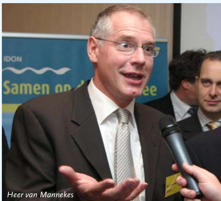
Heer van Mannekes